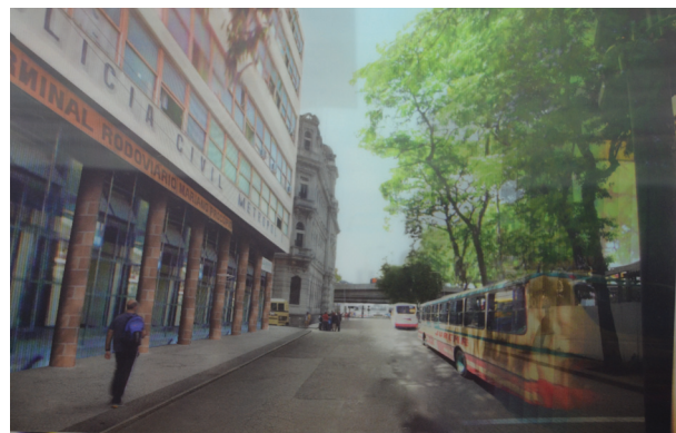
imagem lenticular mostra o edifício antes e depois de ser transformado em museu